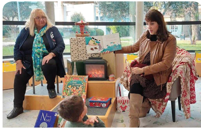
Lectures gourmandes à la Médiathèque Marc Alyn - 13 décembre