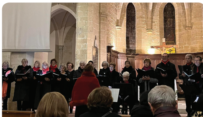
Concert de Noël à la Collégiale par l'association Cantabella