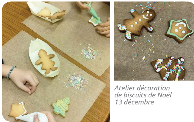
Atelier décoration de biscuits de Noël 13 décembre