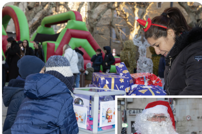
Après-midi de Noël 16 décembre